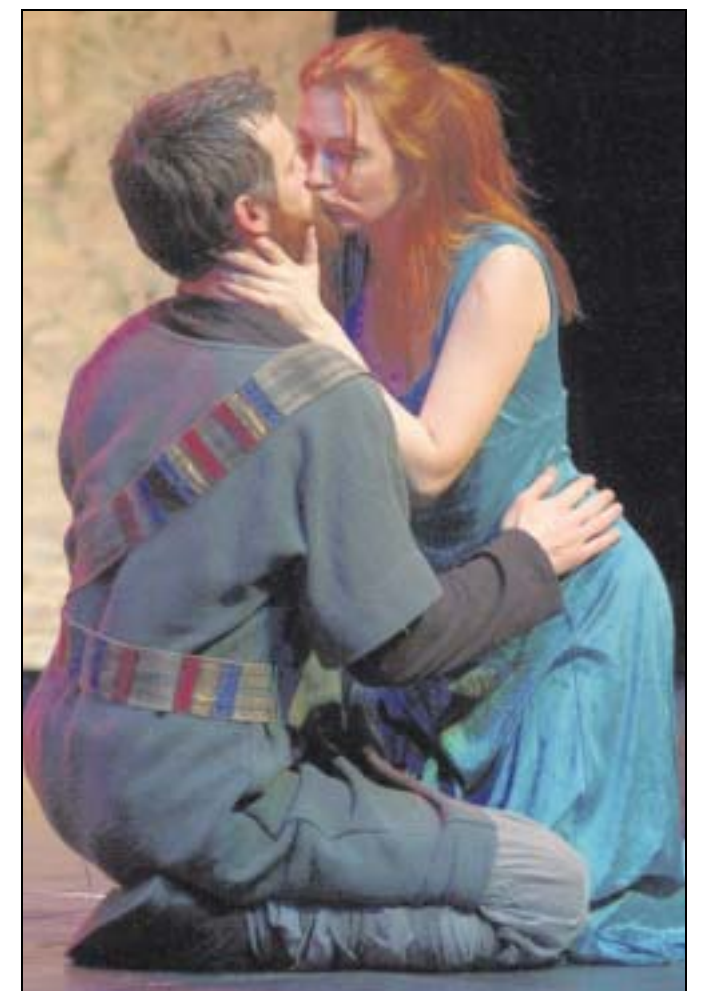
Macbeth und seine Lady: Liebe, Intrigen und Mord rund um den schottischen Königsthron.

Die Schauspiel-Kunst der Darsteller gefiel und die abwechslungsreiche Inszenierung sorgte dafür, dass das lange Stück (über zwei Stunden) nicht langweilig wurde.