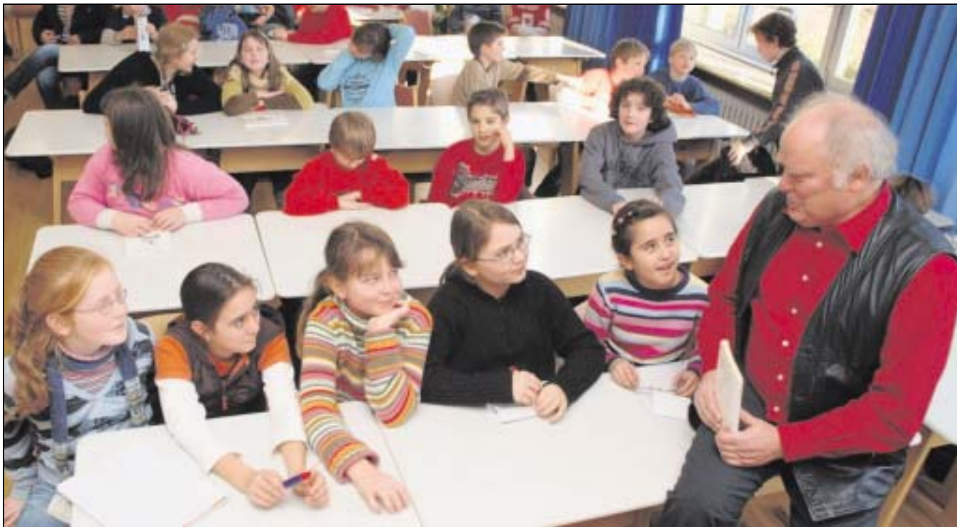
Im Musiksaal des Stenner-Gymnasiums brachte der Essener Autor und Musiker am Montag in zwei Lesungen den Fünftklässlern nicht nur die Geschichte von „Jacko dem Raben“ näher, sondern beantwortete bereitwillig auch alle Fragen.